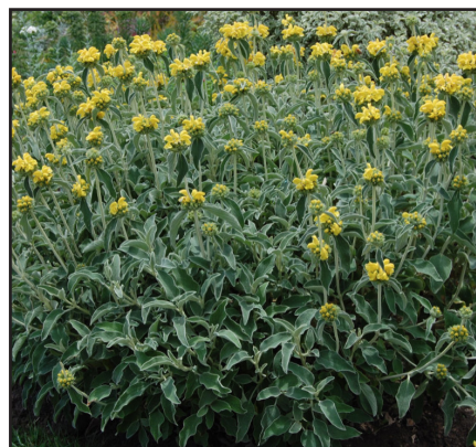
Sage de Jerusalem Phlomis fucifosa