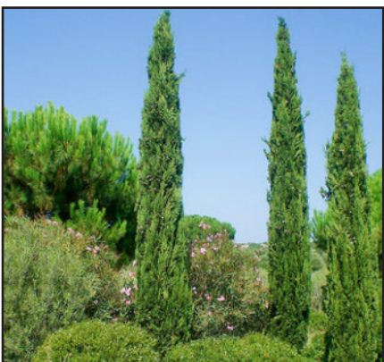
Cyprès de Provence Cupressus sempervirens