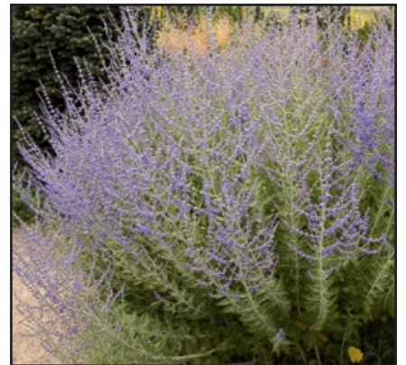
Sauge d'Afghanistan Perowskia blue spire