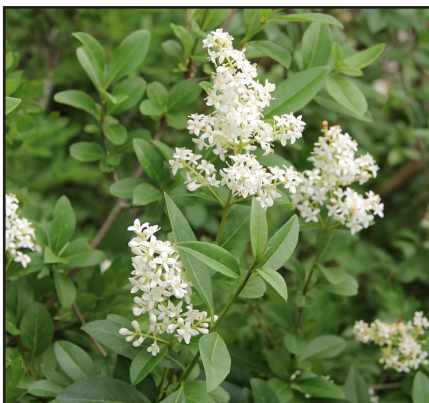
Troène Ligustrum vulgare