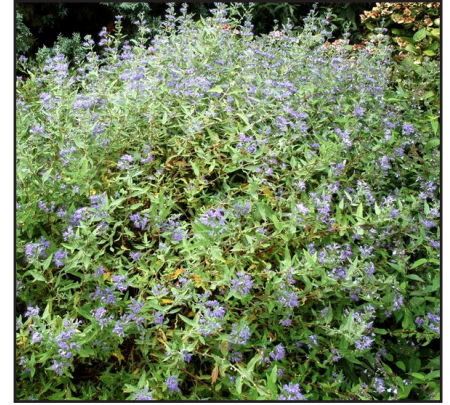
Caryopteris Caryopteris x clandonensis