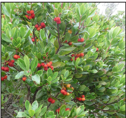
Arbousier Arbutus unedo