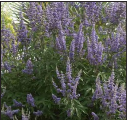
Poirier des moines Vitex agnus-castus