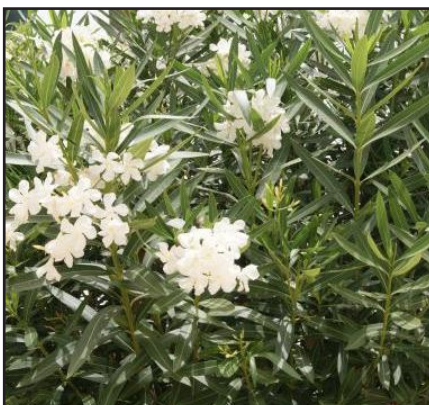
Laurier rose Nerium Oleander