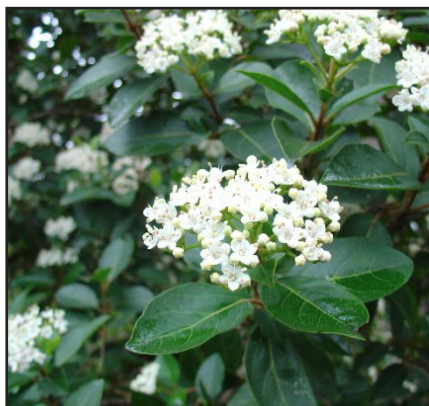
Laurier tin Viburnum tinus