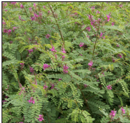
Indigotier Indigofera heterantha