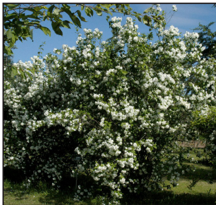
Seringat Philadelphus coronarius