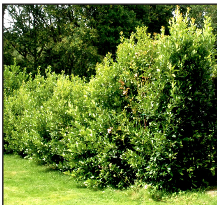
Laurier sauce Laurus nobilis