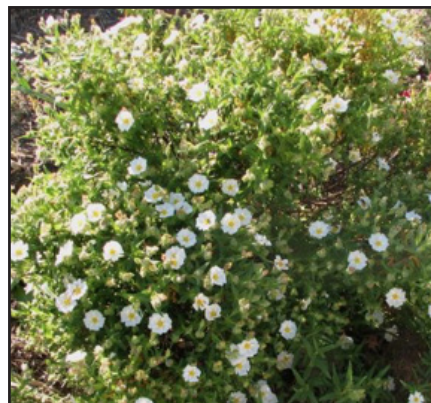
Ciste de Montpellier Cistus Monspeliensis