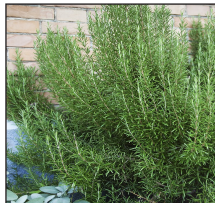
Romarin Rosmarinus officinalis