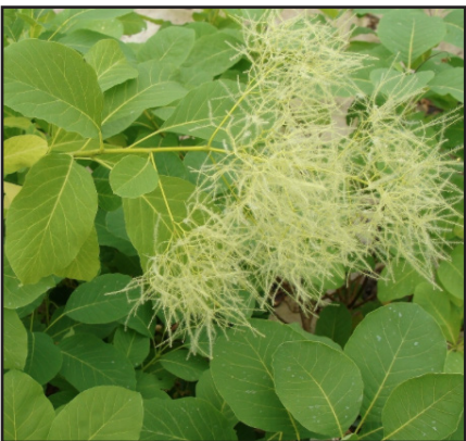
Arbre à perruque Cotinus coggygria