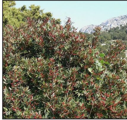
Pistachier térébente Pistacia terebinthus