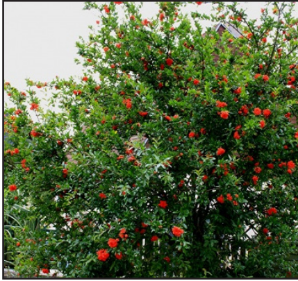
Grenadier Punica granatum